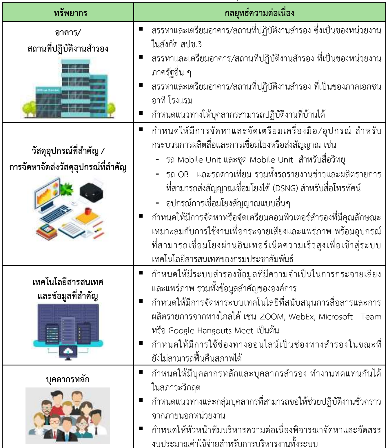
ตารางที่ 4 การบริหารจัดการทรัพยากรให้มีความพร้อมเมื่อเกิดภาวะวิกฤต 5 ด้าน